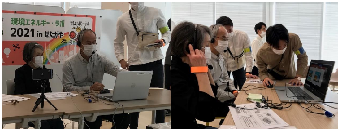
講師の二人 プレゼン内容・PC操作の確認