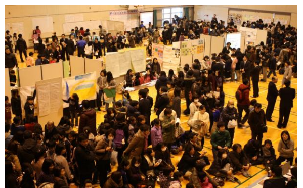
「エネルギー・環境子どもワークショップ in 川崎」

環境・エネルギー教育に取り組む学校は、効果的に学習を進めるため市民団体・企業の出前授業や資料を探しています。逆に市民団体・企業は、見学会やイベントに参加する学校を探しているようです。そこで、ワークショップ実行委員会では、学校と市民団体・企業との橋渡しも積極的に行うようにしています。更に教員からの視点による出前授業への改善提案、施設見学やイベントへのアドバイス等も始めています。もちろん、省エネグループの「夏休みエコライフ・チャレンジ」も各校に宣伝します。