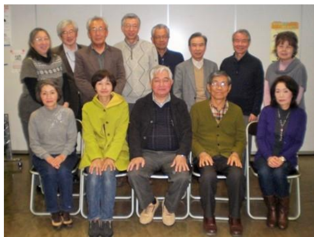
3月の定例会に出席したメンバー

メンバー現在34名です。若い方も居ますが、仕事があるので普段の活動はシニアが中心になって行っています。女性の会員も増えて、きめ細かな対応ができるようになりました。活動の後にはたいてい反省会と称し一杯やることも多く、長い人生経験からの話も聞けて楽しいですよ。お若い方もぜひ参加を！