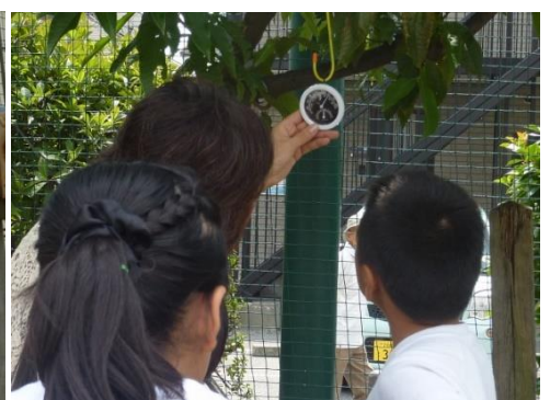
温湿度計で蒸散の効果を観察