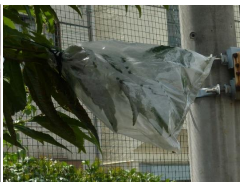
葉っぱをビニール袋で包み、蒸散を目視