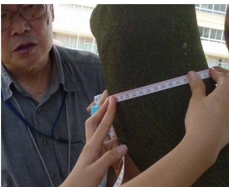
幹の太さを測り、CO 2 の吸収量を計算

また、授業した内容をキッカケにして、自分達で課題を見つけて、調べて、まとめて、校内での発表会、文化祭で発表をしてくれています。これも嬉しいことで、益々力を入れて出前授業に取り組んで行かなければと考えています。